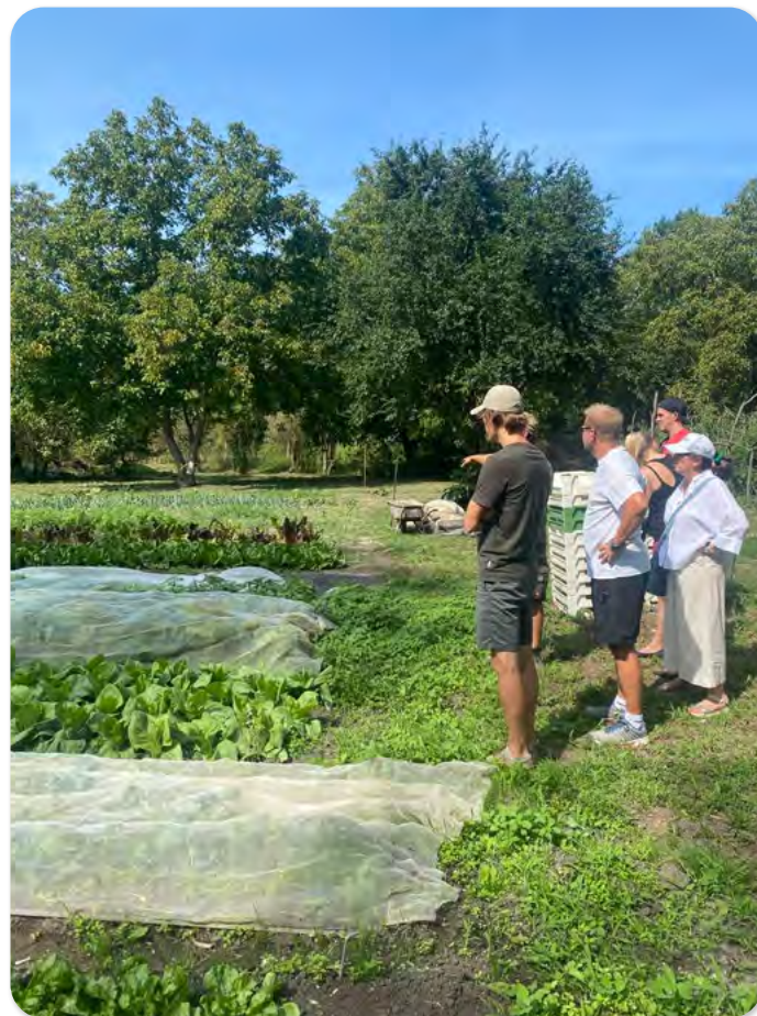
Foodcoop Wulkakistl zu Besuch im Neudlhof in Wulkaprodersdorf.

angetreten und haben sich gut gehalten. Wir hatten jede Menge Spaß zusammen.