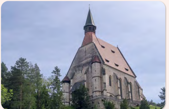
Wehrkirche von Kirchberg am Wechsel

Der Fotoclub Forchtenstein-Rosalia freut sich schon heute auf Ihren Besuch.